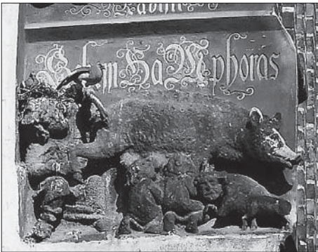
Die sogenannte Judensau an der Stadtkirche zu Wittenberg von 1304 mit der Schmähung der jüdischen Bezeichnung des heiligen Gottesnamens (Schem hameforasch).

Ende Januar 1546 unternahm Martin Luther seine letzte Reise, die ihn nach seiner Geburtsstadt Eisleben führte, wo er am 18. Februar starb. Unterwegs erlitt er bereits einen Herzinfarkt, von dem er seiner Frau Käthe vier Tage später brieflich berichtete: „Ich bin ja schwach gewesen auff dem weg hart vor Eisleben, Das war meine schuld. Aber wenn du werest da gewest, so hettestu gesagt, Es were der Juden oder ihres Gottes schuld gewest ...“ Diese mittelalterliche judenfeindliche, oft bösertige, bestenfalls misstrauische Haltung war im 16. Jahrhundert die allgemein verbreitete.